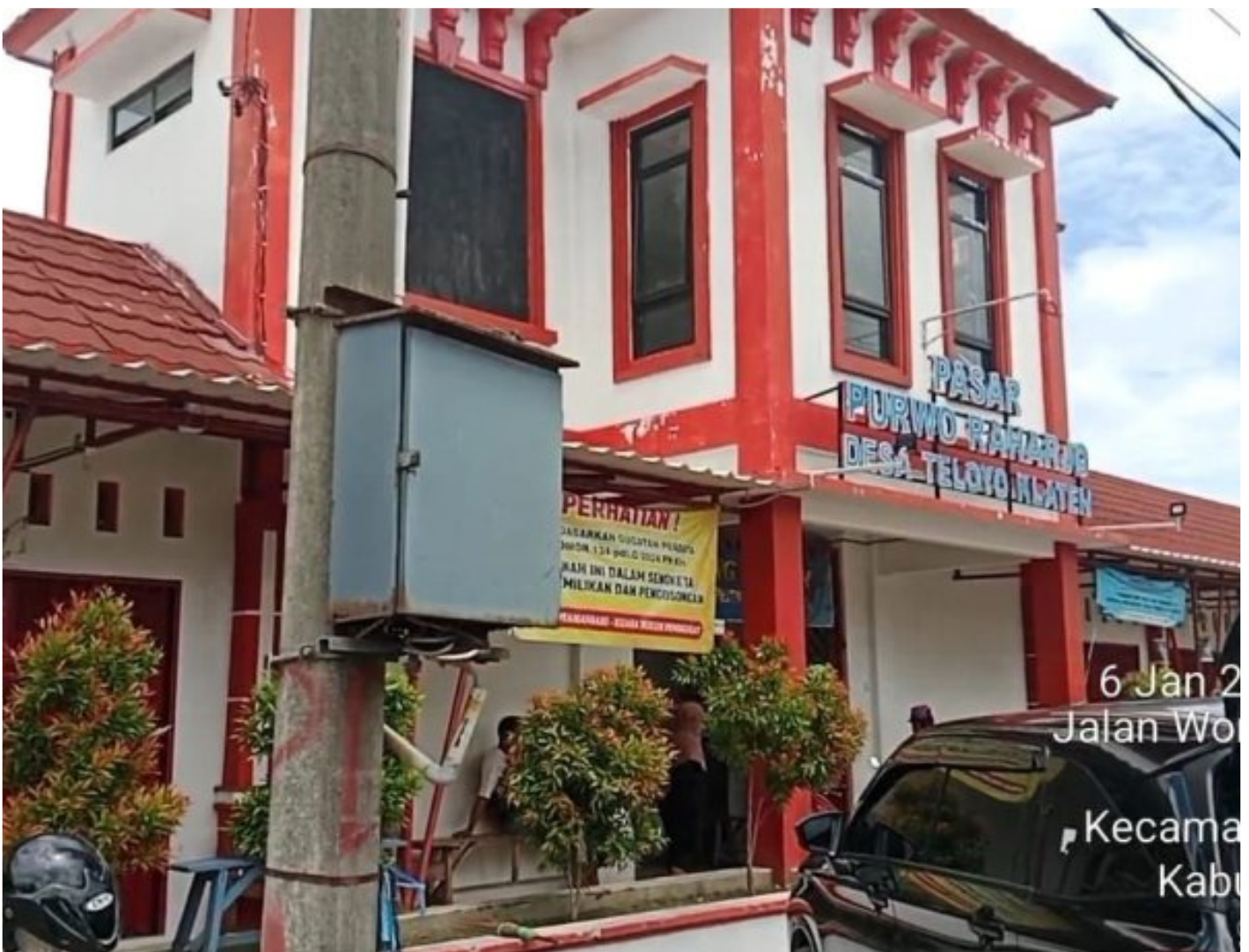
Foto: Pasar Purwo Raharjo di Desa Teloyo, Kecamatan Wonosari, Kabupaten Klaten, kembali memicu perhatian publik.

KLATEN - Polemik sengketa tanah Pasar Purwo Raharjo di Desa Teloyo, Kecamatan Wonosari, Kabupaten Klaten, kembali memicu perhatian publik.